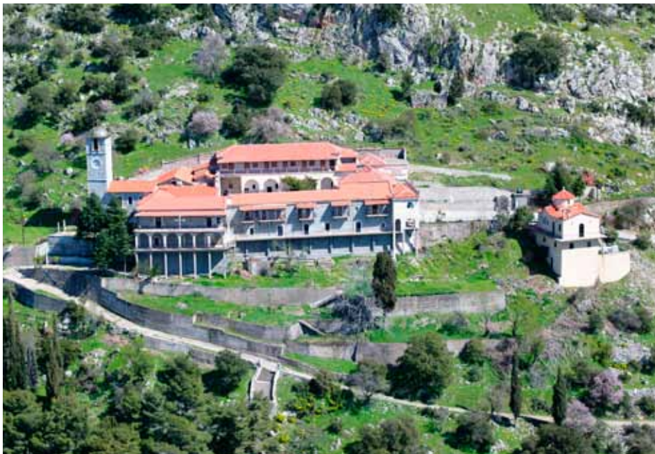
Τερά Μονή Γοργοπηκίου Νεστάνης