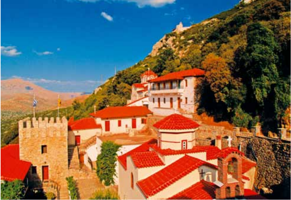
Ἱερά Μονή Βαρσῶν

περιοχή, πού δέν ἔχει οὔτε καν ὀπτική ἐπαφή μέ τήν θάλασσα.