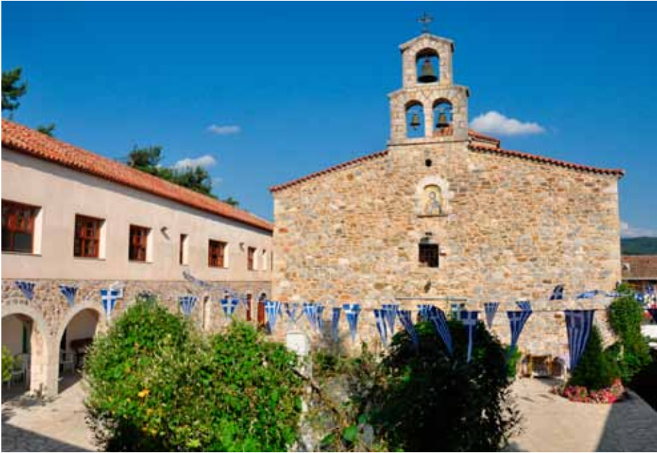
Τερά Μονή Καλτεζών

Τρίκορφα καί Δαμιανός. Ἀγωνιστικό παρών ἔδωσε στήν ἔθνική προσπάθεια καί ὁ Ἡγούμενος τῆς μονῆς Βαρσών Συμεών, ἐνῶστά πεδία τῆς μάχης ἔλαβαν μέρος καί τρεῖς ὀπλοφόροι μοναχοί τῆς ἴδιας μονῆς.