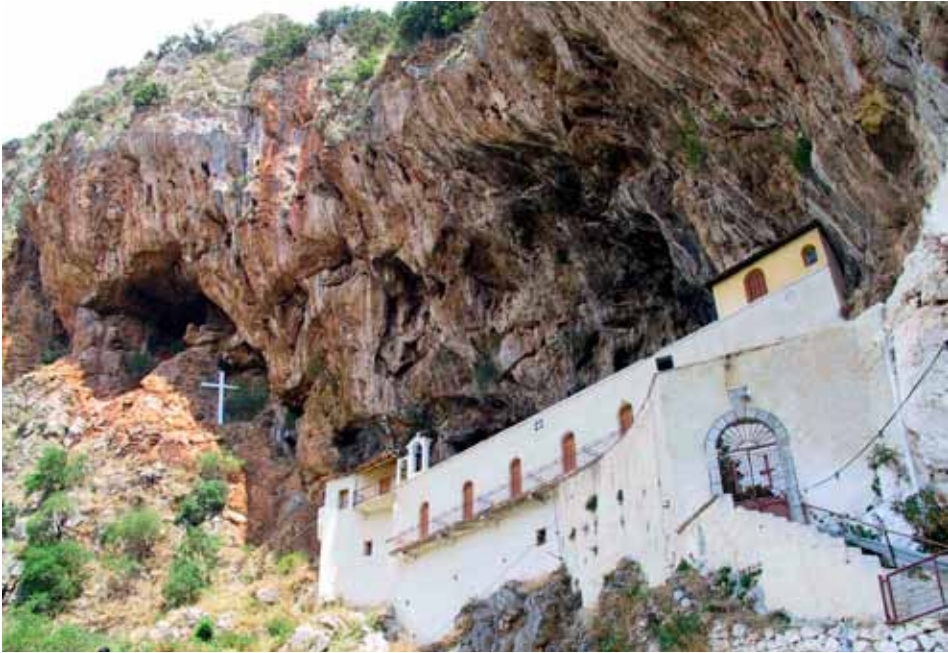
Τερά Μονή Κανδήλας

κινητά τους κατασχέθηκαν και έκποιήθηκαν, ενώ οι μοναχοί τους διασκορπίστηκαν σε άλλα διατηρητέα μοναστήρια!