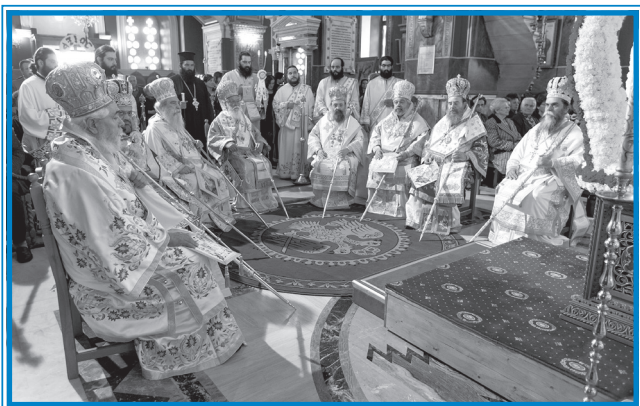
Από τό Αρχιερατικό Συλλείτουργο στόν Μητροπολιτικό Ναό τήν 5/5/2014.

Ταυλαδωράκη, τόν μετατεθέντα στόν Πειραιᾶ. Δέν τόν ἤξερα κι αὐτόν, πρώτη φορά τόν ἔβλεπα, ἀλλά τώρα ἤμουν μέ πτυχίο στό χέρι μου καί εἶχα ἄλλο λόγο. Κάθησα στό γραφεῖο τοῦ Δεσπότη καί περίμενα νά μοῦ δώσει τόν λόγο, νά τοῦ πῶ γιατί πῆγα ἐκεῖ. Ἀλλά, μοῦ λέει σέ μιά στιγμή, ἀφοῦ μέ ἄφησε λίγο διάστημα καί μέ παρακολουθοῦσε, φαίνεται (ἔκανε ὅτι ἐργαζόταν), σηκώνει τό κεφάλι του ἀπότομα καί μοῦ λέει: «Κύριε Ἀλέξανδρε, πρέπει νά προσέχετε τά πόδια σας». «Ἄλλο πάλι», λέω, «πάλι τά πόδια μου!» Κοίταζα πάλι μήπως ἔχω λάσπες, μήπως ἔχω λερωμένα πόδια, δέν ἔβλεπα τίποτα. Καί μέ τό ὕφος τό αὐταρχικόν, πού εἶχε, ἀλλά εὐγενικόν, ὁ ἀείμνηστος Ταυλαδωράκης, μοῦ λέει καί μοῦ ἀπαγγέλει, ἔτσι, σάν ποιηή: «Δέν μπορεί, ἀγαπητέ μου, ὁ Θεολόγος νά φοράει παρδαλή γραβάτα καί κόκκινες κάλτσες». Τί ἦτανε, δηλαδή, οἱ κόκκινες κάλτσες; οἱ κάλτσες μου εἶχανε μιά γραμμούλα κόκκινη ἐπάνω καί ἡ γραβάτα μου εἶχε κάτι καρεδάκια, ἔτσι, φοιτητής ἤμουν, καταλαβαίνετε τί γραβάτα θά εἶχα. «Γι' αὐτό πρέπει νά συμμορφωθεῖς στόν κανόνα τῆς τάξεως καί τότε νά ἐπανεέλθης». Μ' ἔδωξε κι ἐκεῖνος, δηλαδή. Ἀλλά, εἶχα τό πτυχίο τοῦ Πανεπιστημίου καί διορίστηκα καθηγητής στήν Τεχνική Σχολή κι ἔτσι προχώρησε ἀπό κεί καί πέρα ἡ πορεία τῆς ζωῆς μου.